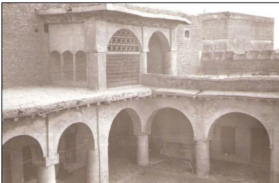
وینہی قہسری عہتاو للاً تاغا کہ مالی باوکی رہمزی بوو