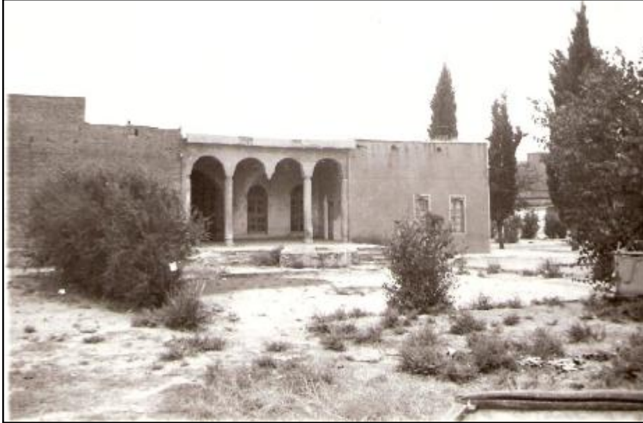
قهسرى عهتاللا ناغا كه مالى باوكى ردهمزي بوو