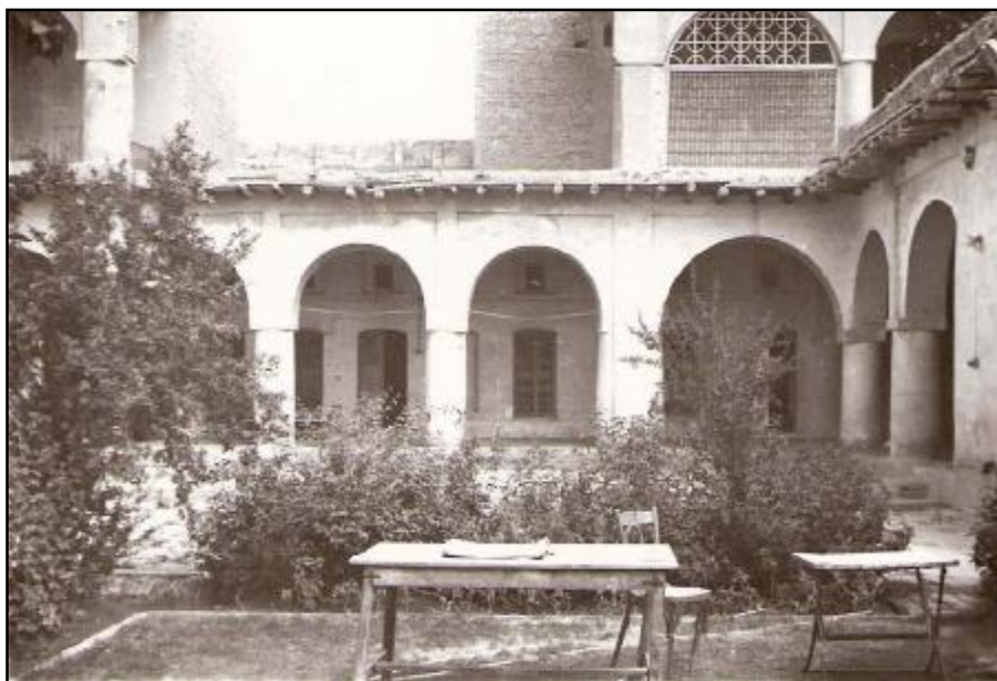
وینہی قہسری عہتاو للاً تاغا کہ مالی باوکی پرمزی بوو