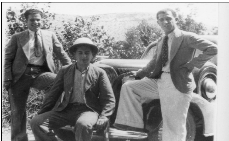
پښه مزى له گهڼ کورپانى پورى، موخته سه م و محه مه د فه تاح چه له بى